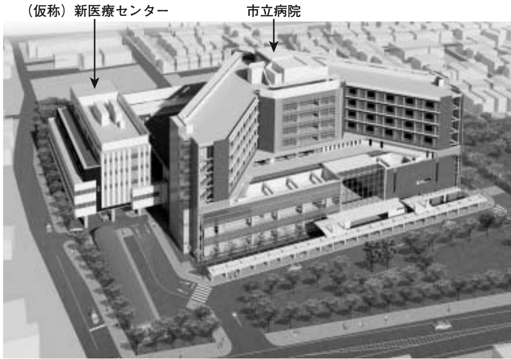
(仮称) 新医療センターは現在の市立病院に隣接して建設されます